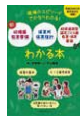
幼稚園教育要領・保育 所保育指針・幼保連携 型認定こども園教育・ 保育要領が「わかる本」 ひかりのくに