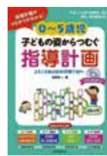
0~5歳児 子どもの姿からつづむ 指導計画 ひかりのくに