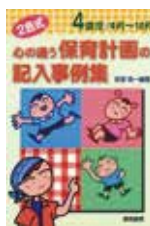
心の通う保育計画の 記入事例集 黎明書房